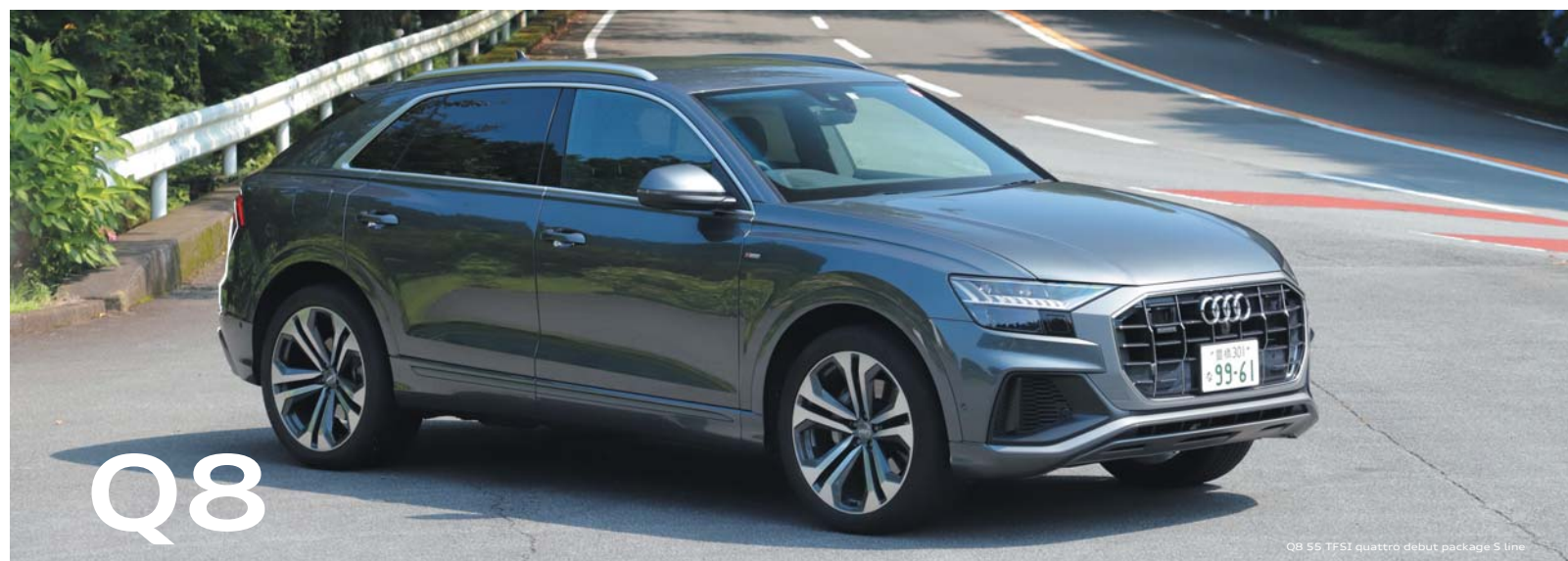
Q8 55 TFSI quattro debut package 5 line

Q8 55 TFSI quattro 10,100,000円 [税込み] + オプション 450,000円 [税込み] の場合