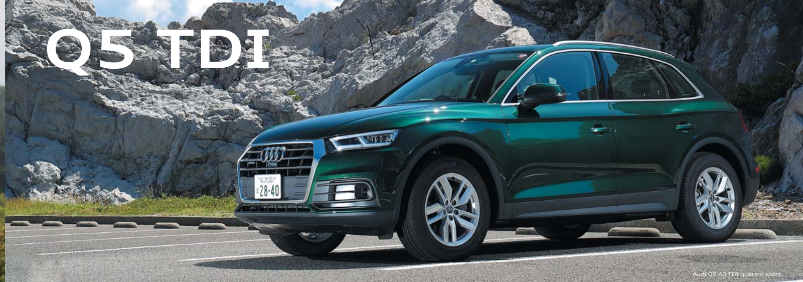
Audi Q5 40 TDI quattro sport

Audi Q5 40 TDI quattro sport 6,700,000円 [税込み] + オプション 450,000円 [税込み] の場合